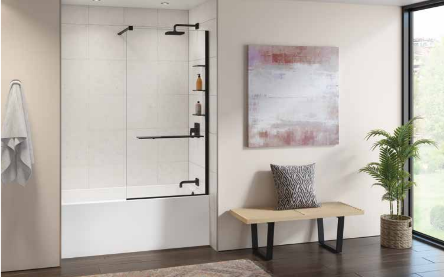
Model shown / Modèle présenté : VTRT33-33-40R