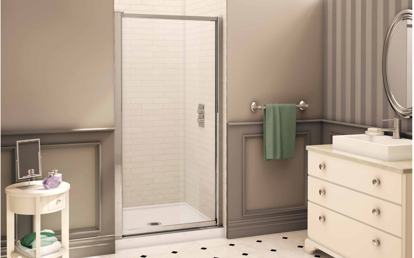
Model shown / Modèle présenté : M2-3335-11-40