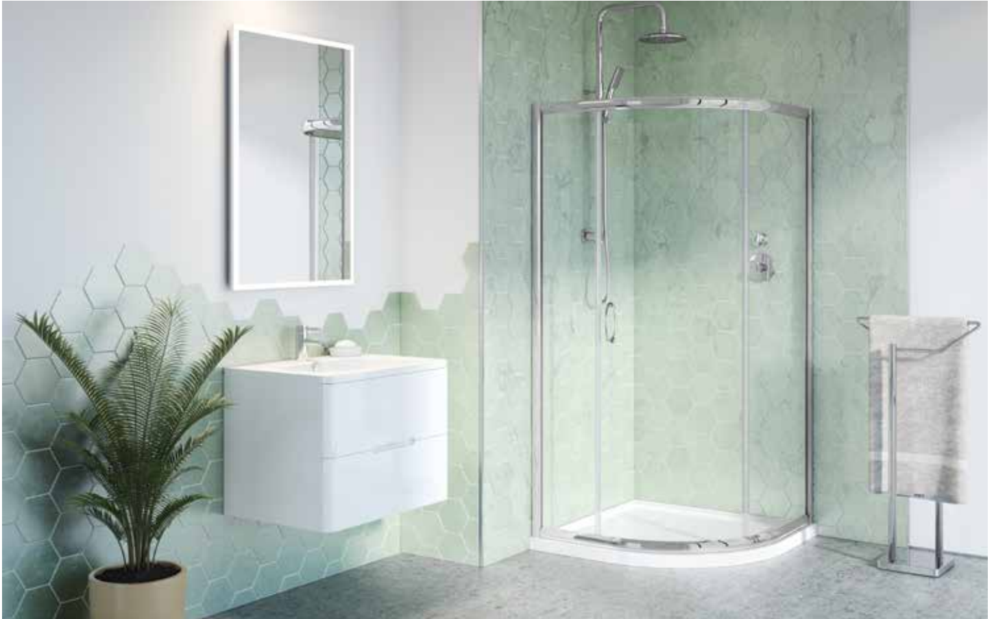
Model shown / Modèle présenté : FA363-11-40

Curved sliding door / Porte coulissante courbée