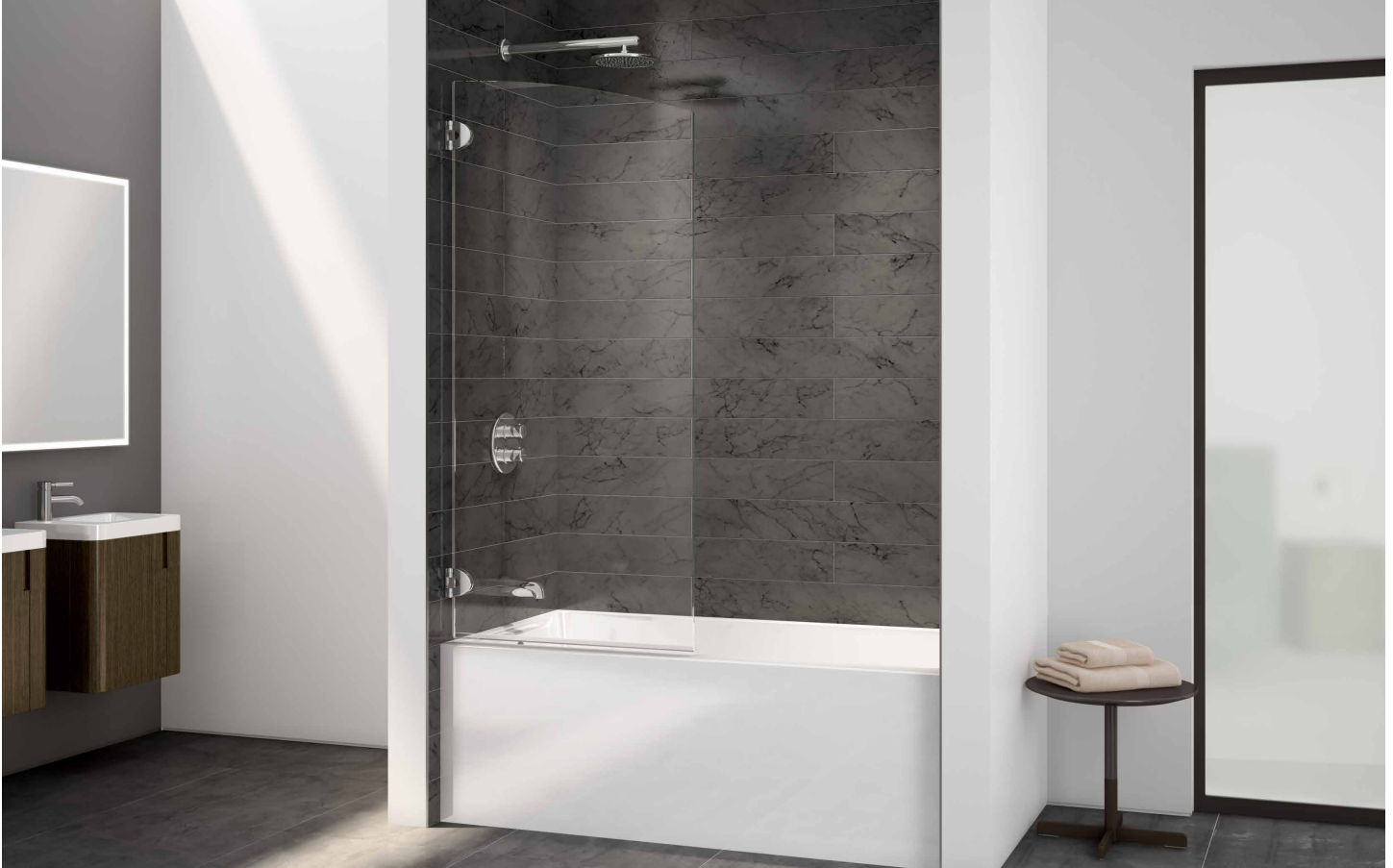
Model shown / Modèle présenté : VQRXTO29-11-40

Round top with oval hinges / Arrondi avec charnières ovale