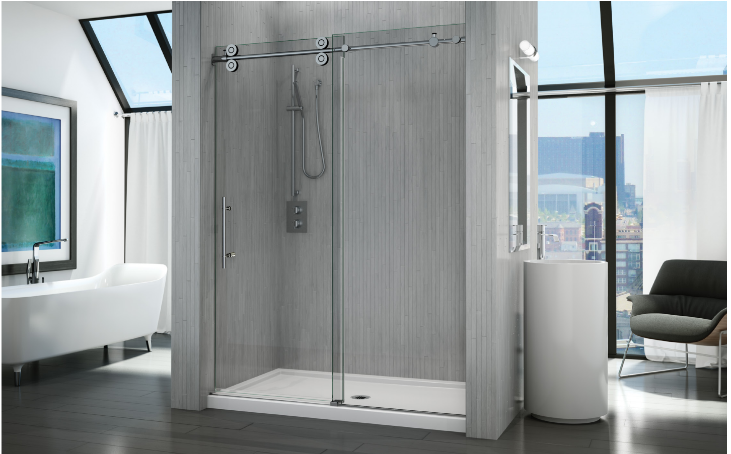
Model shown / Modèle présenté : Kinetik KTA In-line / Kinetik KTA en alcôve (KTA57-11-40)

Sliding door and fixed panel / Porte coulissante et panneau fixe