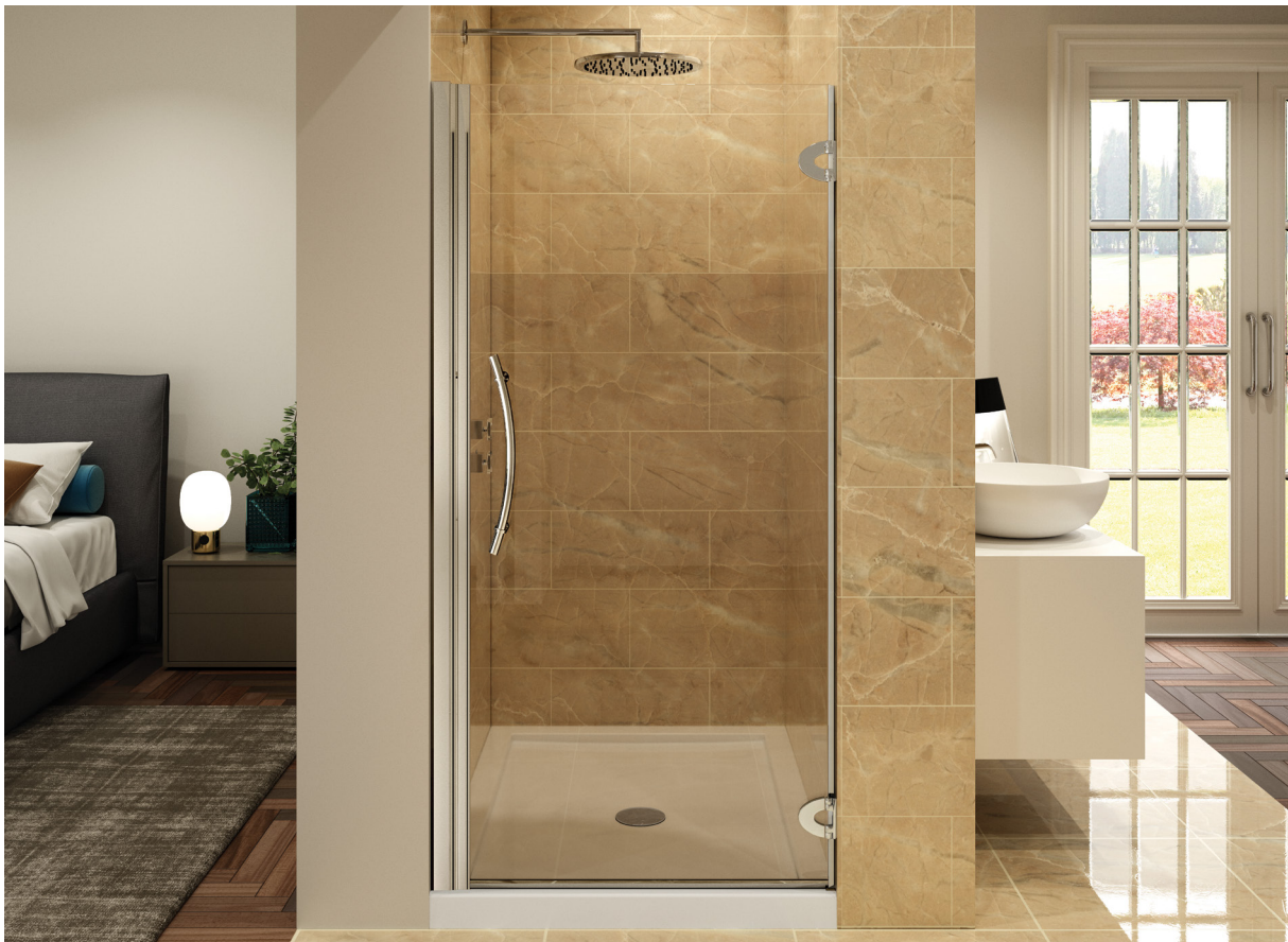
Model shown / Modèle présenté : PK32-11-40R-QB-79