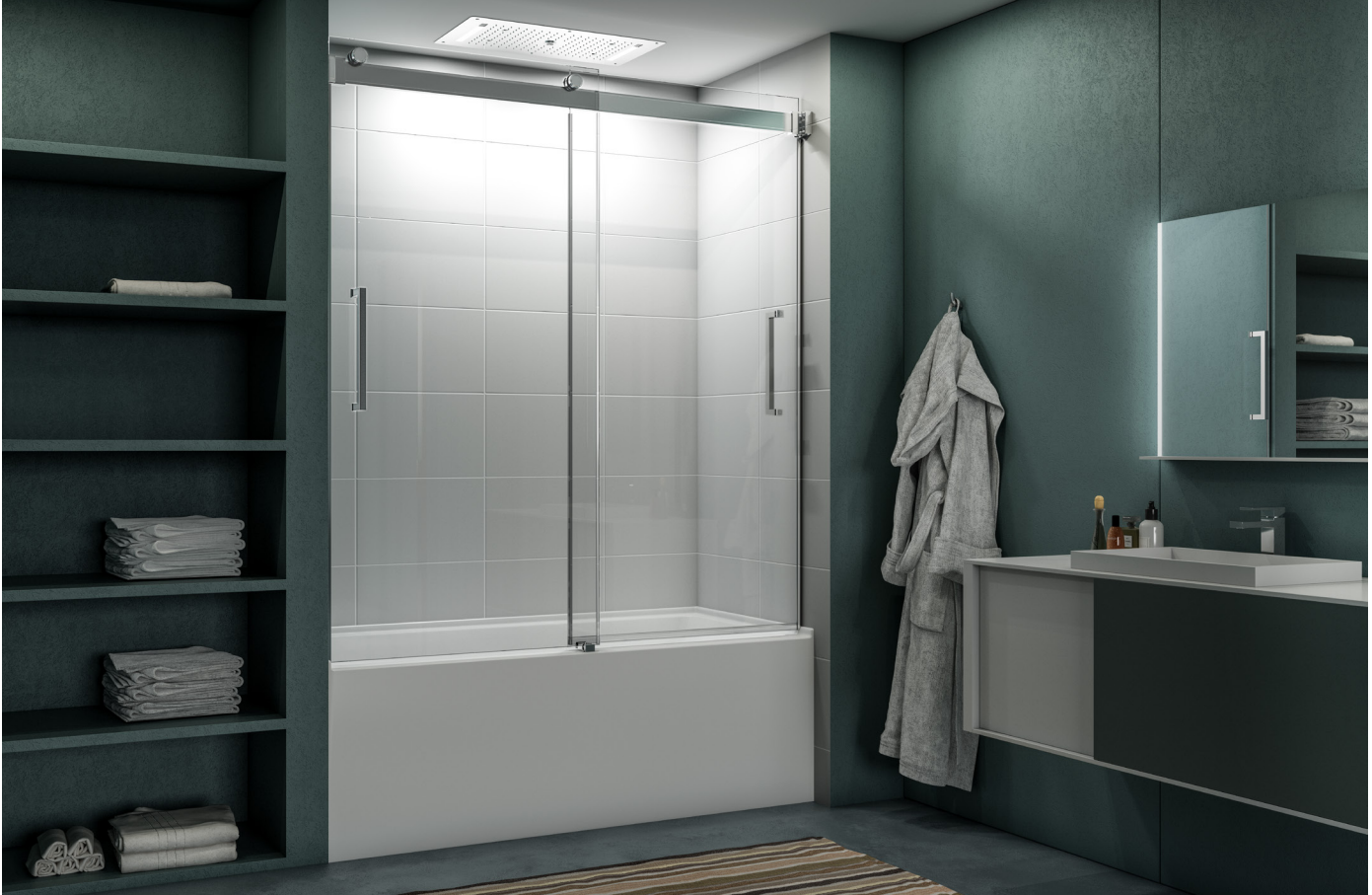
Model shown / Modèle présenté : Mercury Bypass Tub Enclosure / Mercury bidirectionnel pour baignoire (NMST60-11-40R)

Frameless sliding tub doors / Portes coulissantes bidirectionnelles sans cadre pour baignoire