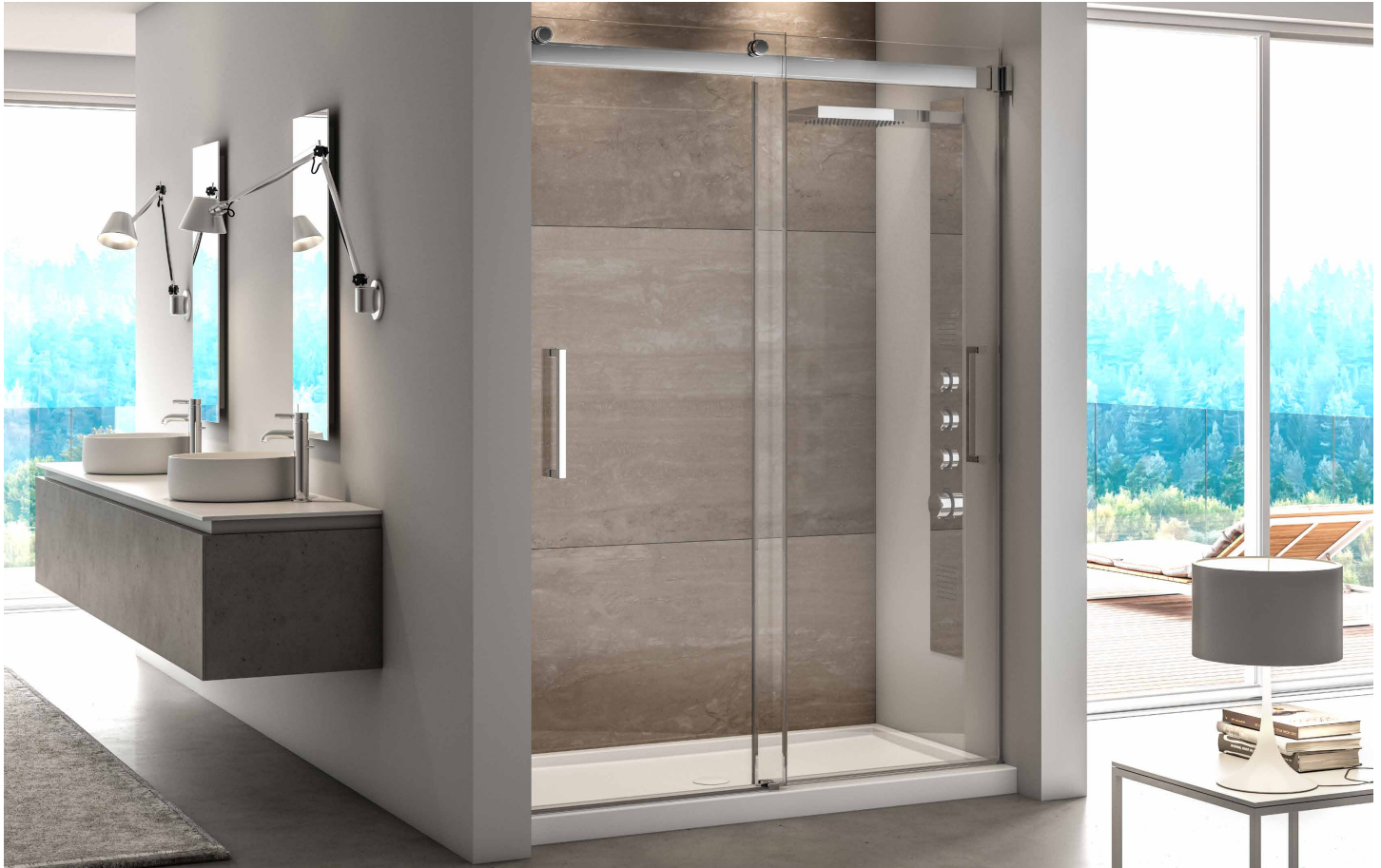
Model shown / Modèle présenté: NMS160-11-40R-79

Bypass sliding doors / Portes coulissantes bidirectionnelles