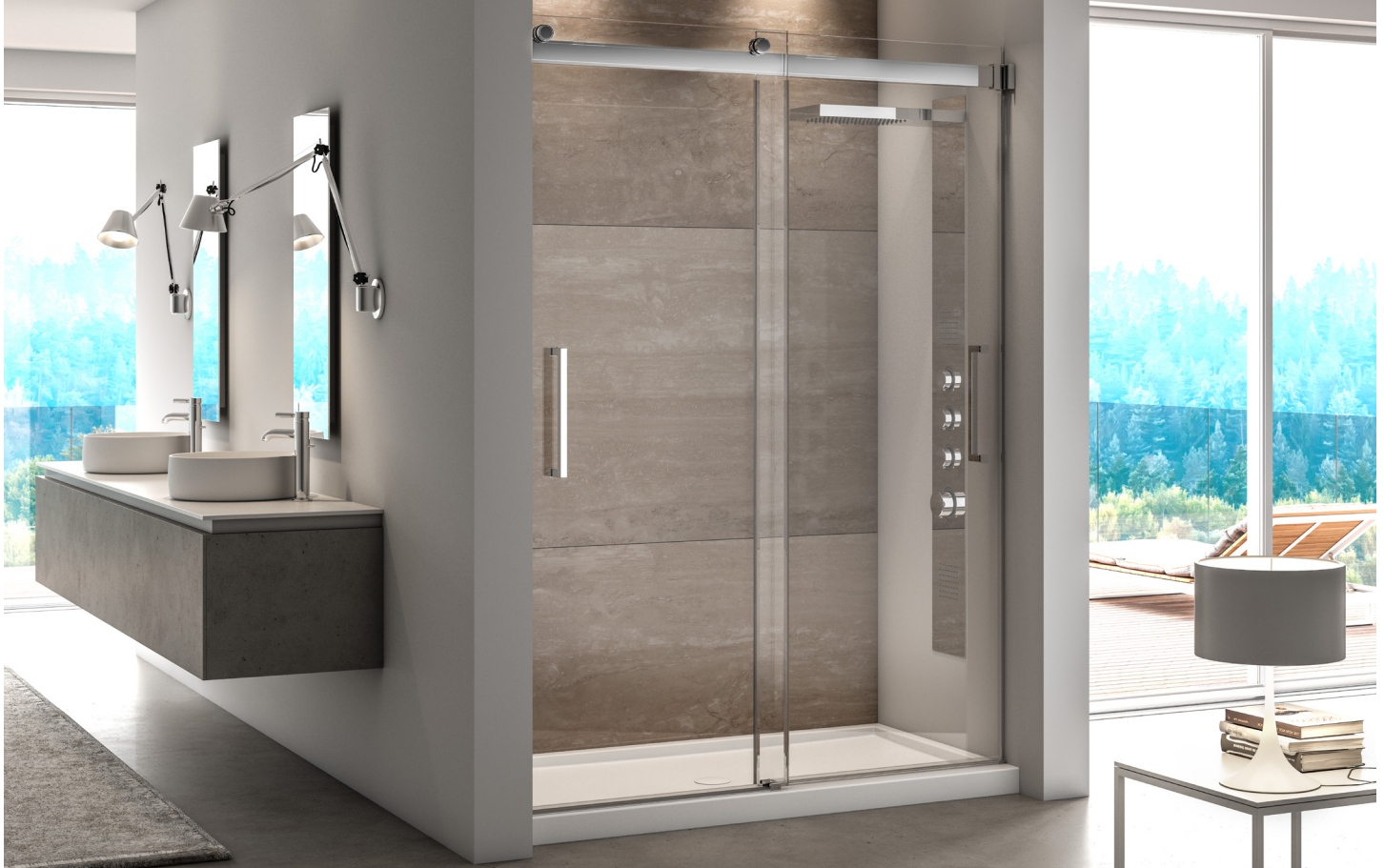
Model shown / Modèle présenté : Mercury In-Line Bypass / Mercury en alcôve bidirectionnel (NMS160-11-40R-79)