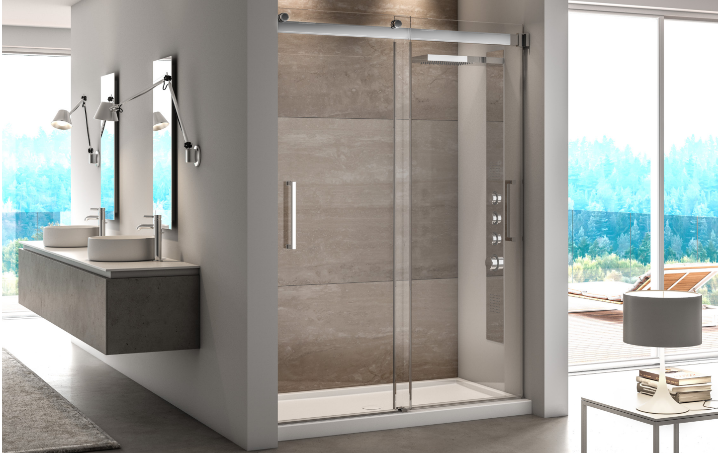
Model shown / Modèle présenté : Mercury In-Line Bypass / Mercury en alcôve bidirectionnel (NM160-11-40)