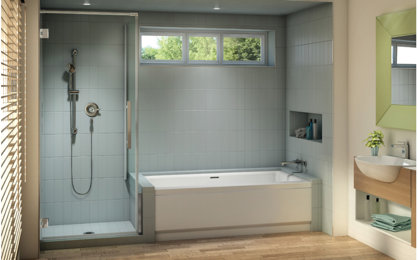
Model shown / Modèle présenté: PWJQ3636-11-40L-MD-63

Door with knee wall return panel with wallmount hinges Porte de douche et panneau de côté avec acharnières au mur