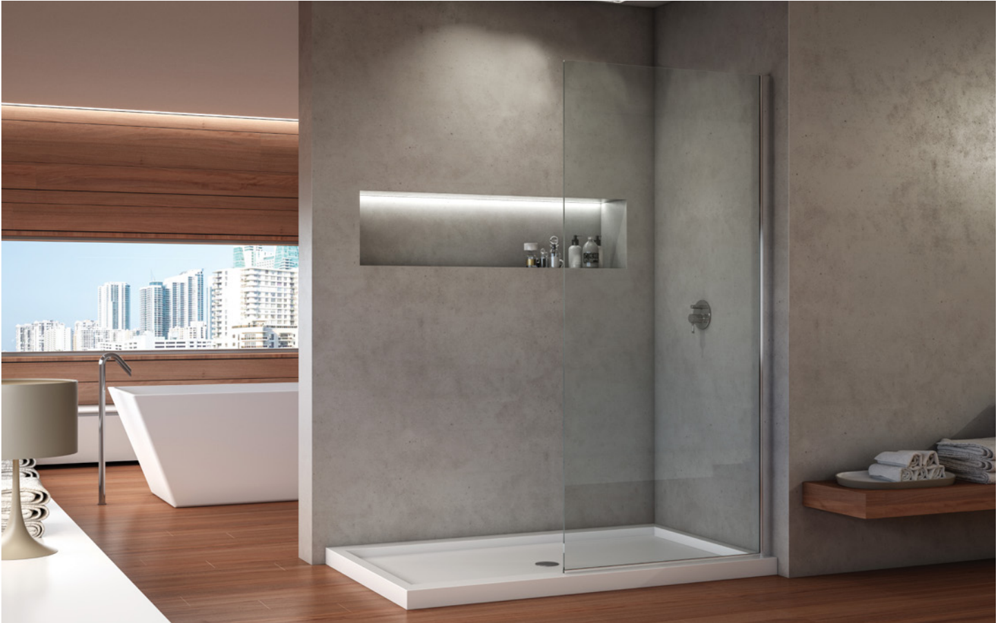
Model shown / Modèle présenté : VSXS30-11-40-79