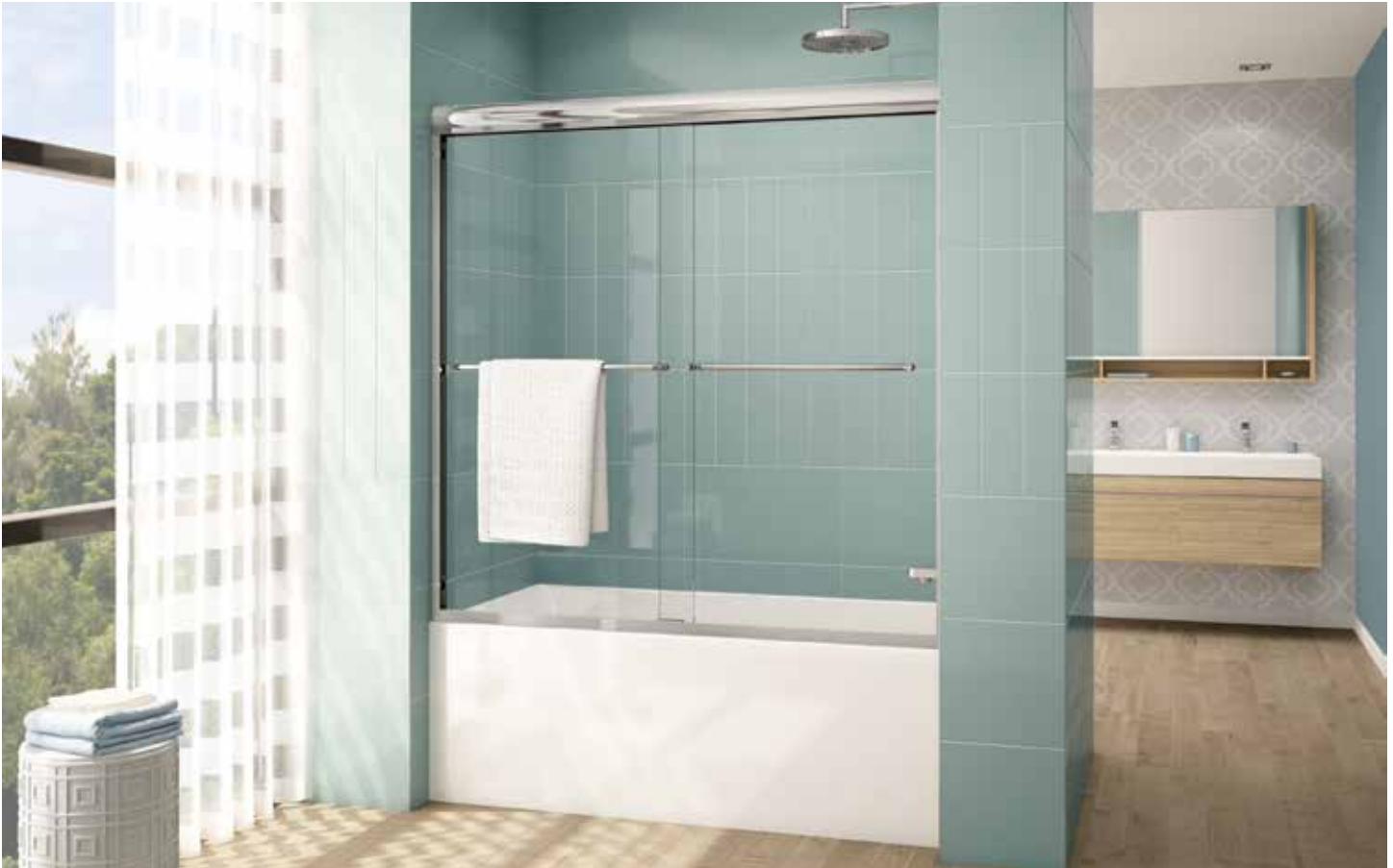
Model shown / Modèle présenté : CLT66-11-40

Semi-frameless in-line sliding tub doors / Portes de baignoire coulissantes avec cadre partiel