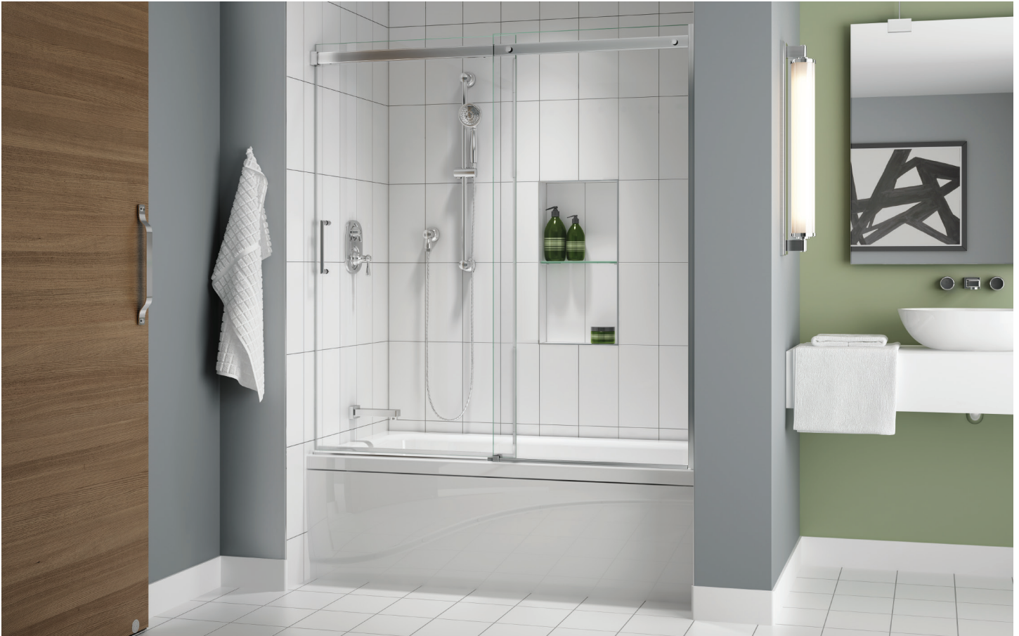
Model shown / Modèle présenté : NAT60-11-40

Sliding door and fixed panel / Porte coulissante et panneau fixe