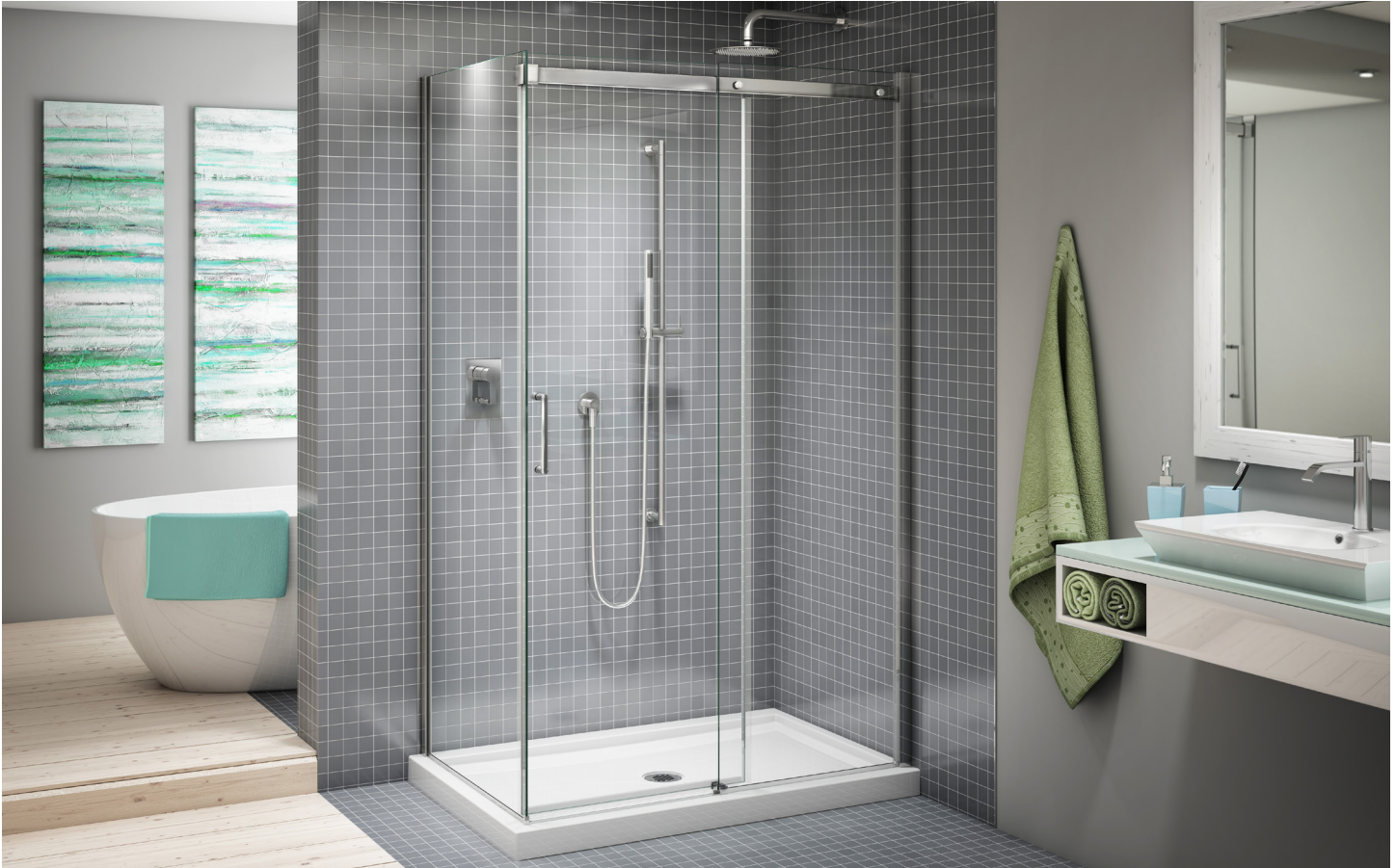
Model shown / Modèle présenté : Apollo 2 Sided CRP / Apollo à 2 côtés CRP (NA4836-11-40)

Sliding door and fixed panel with return panel / Porte coulissante et panneau fixe avec panneau de retour