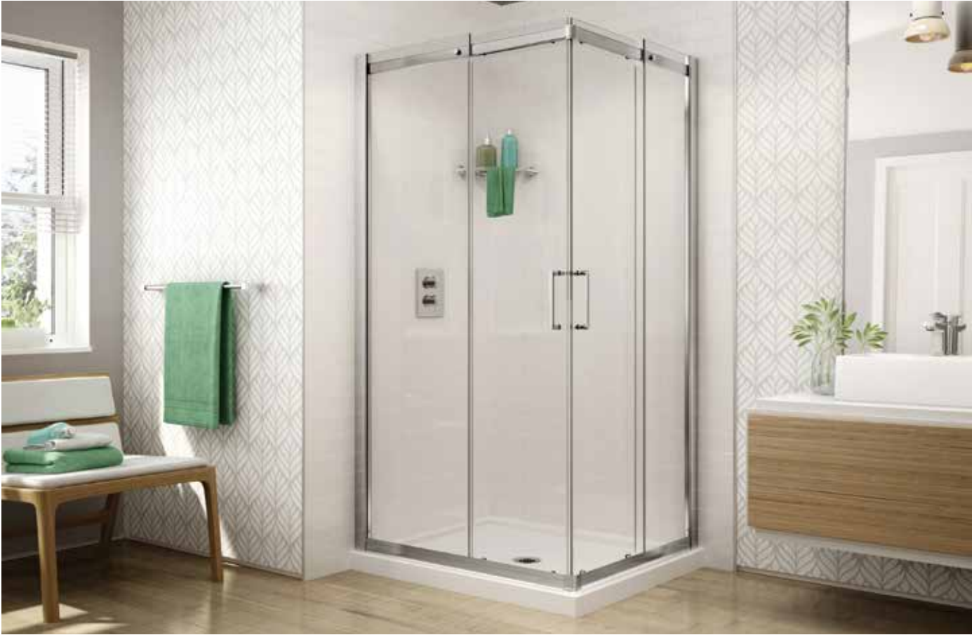
Model shown / Modèle présenté: STC42-11-40

Semi-frameless corner entry sliding doors / Portes coulissantes à entrée en coin avec cadre partiel