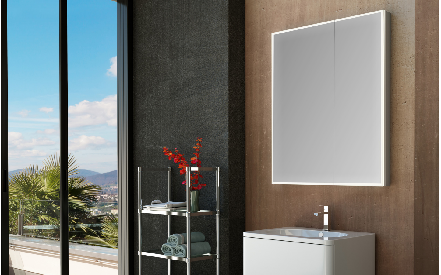
Model shown / Modèle présenté : MCHB3036-14

Double panel medicine cabinet / Armoire à pharmacie à deux panneaux