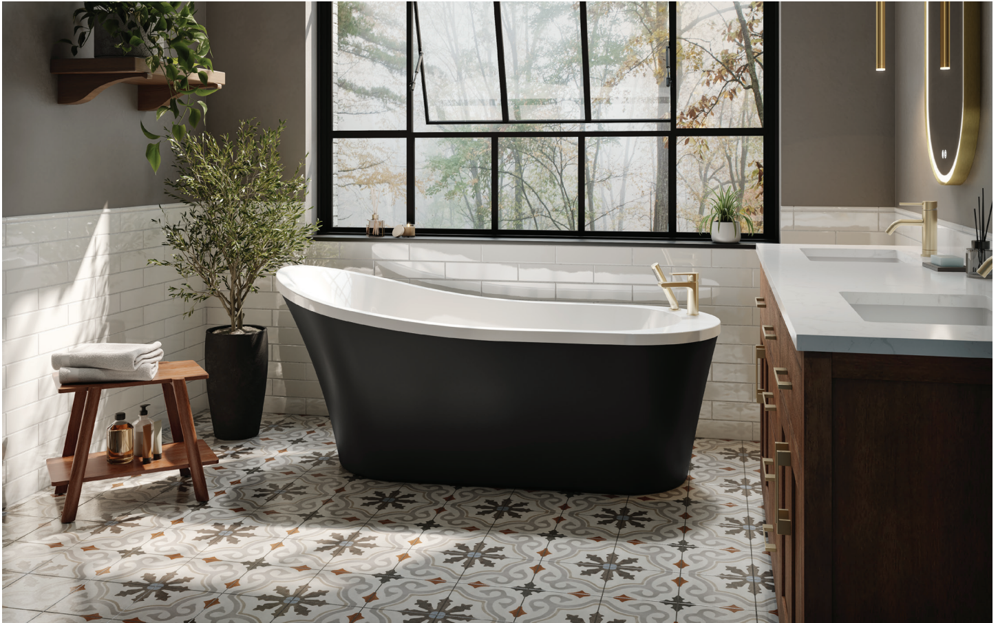
Model shown / Modèle présenté : BZMZ6730-1833