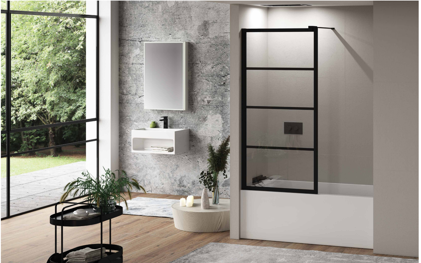
Model shown / Modèle présenté : LAVT32-33-43

Fixed panel tub shield / Panneau fixe écran de baignoire