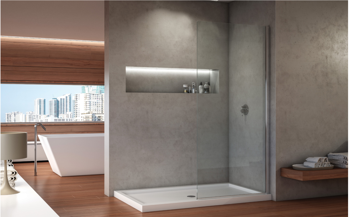
Model shown / Modèle présenté : VSXS30-11-40-79