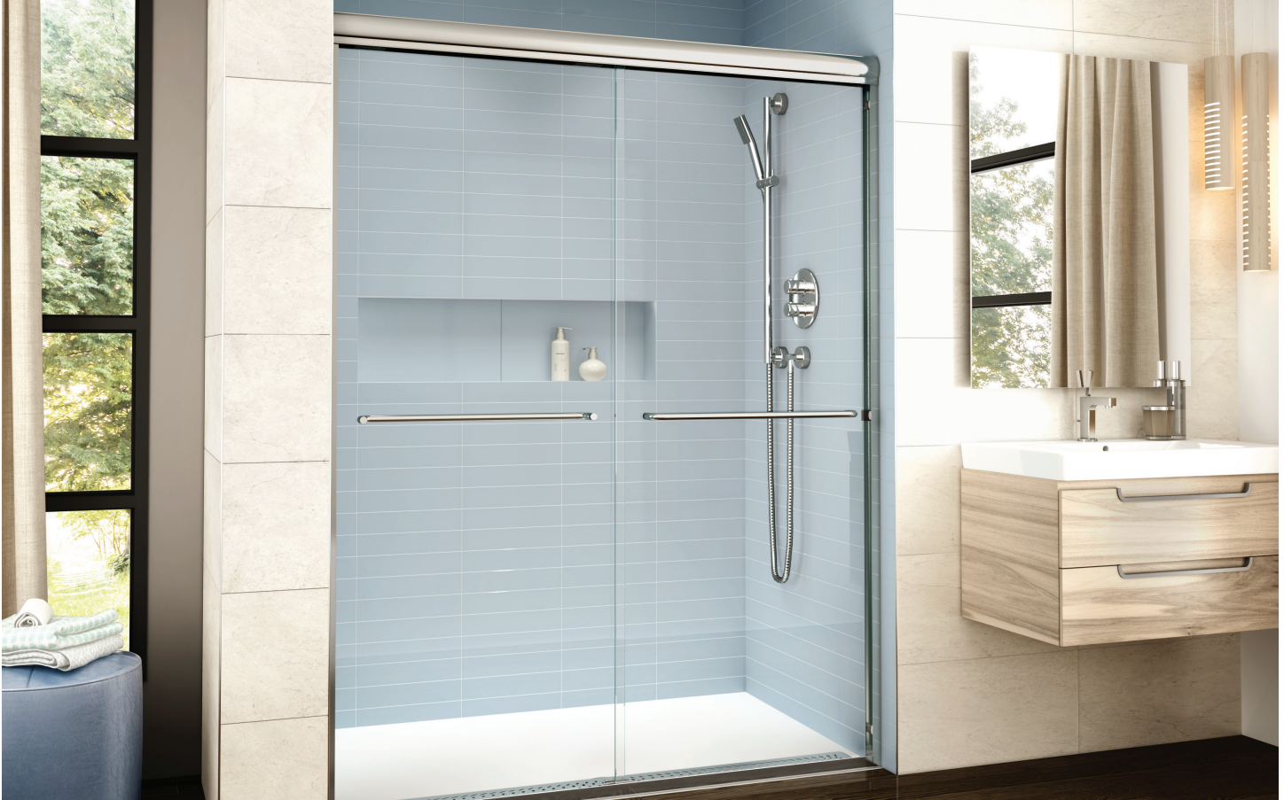
Model shown / Modèle présenté : CLS160-11-40