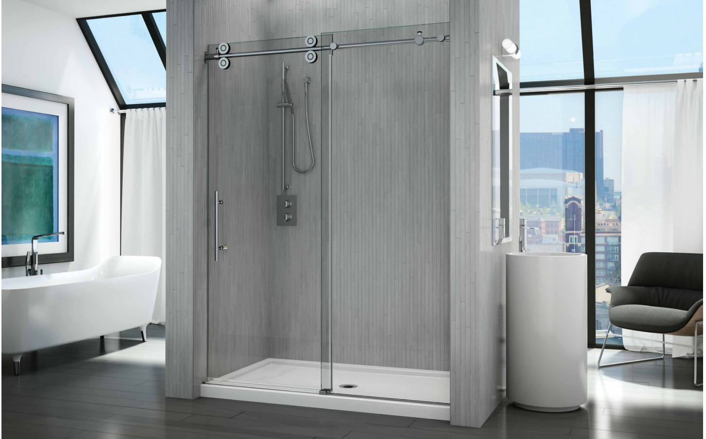
Model shown / Modèle présenté : KTA57-11-40

Sliding door and fixed panel / Porte coulissante et panneau fixe