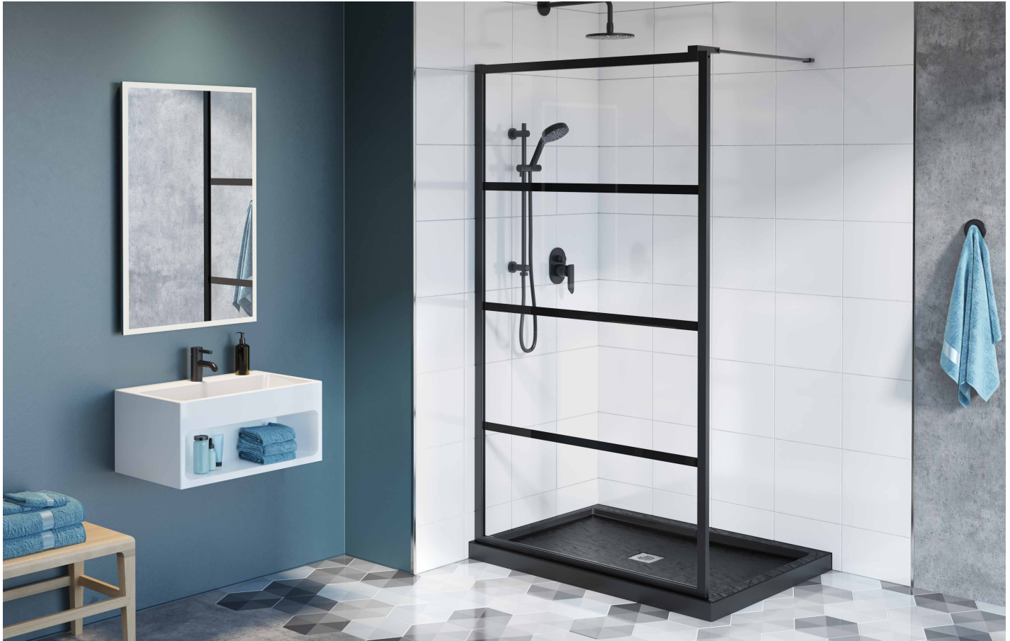
Model shown / Modèle présenté : LAV44-33-43-79

Fixed panel shield / Panneau fixe écran de douche