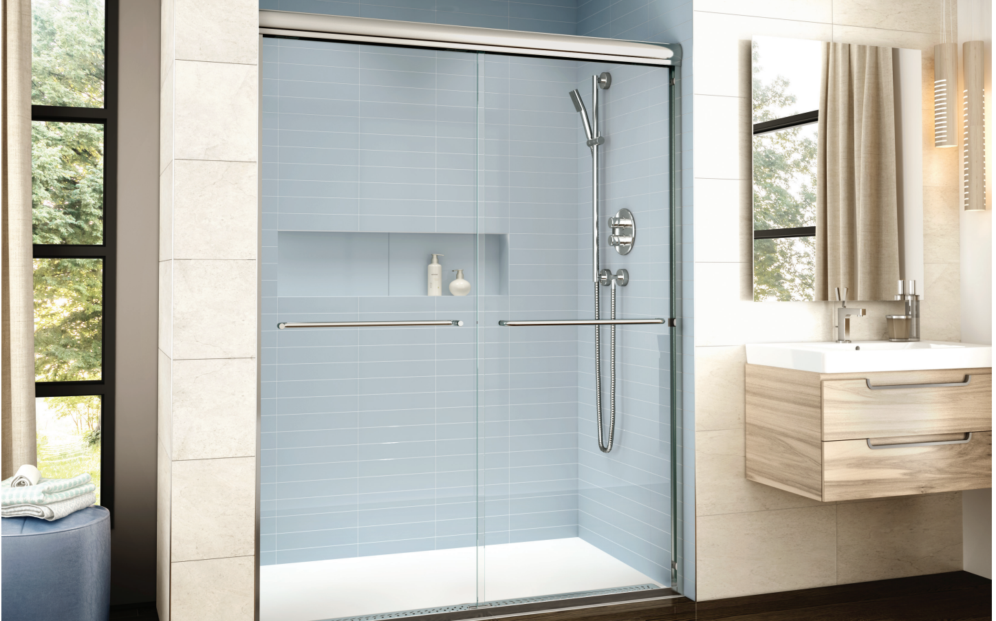
Model shown / Modèle présenté : CL161-11-40

Semi-frameless in-line sliding shower doors / Portes de douche coulissantes avec cadre partiel